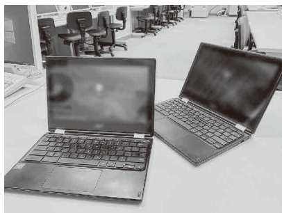
教育に活用される情報端末

小学校1年生から中学校3年生までの全児童生徒に情報端末が整備され、町内全学校にインターネット環境が整い、情報技術を活用した教育環境が整います。