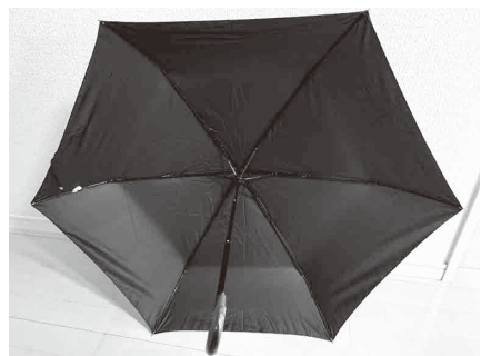
子ども用日傘 筑後市が全小中学生に配布