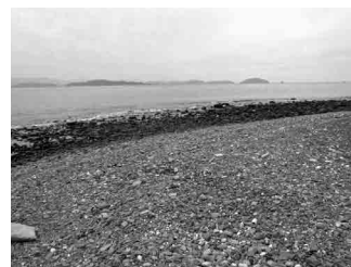
漂着ごみの回収を行っています（相島） （左：実施前 右：実施後）