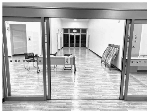
台風10号に備え自主避難所を開設した ふれあい交流館