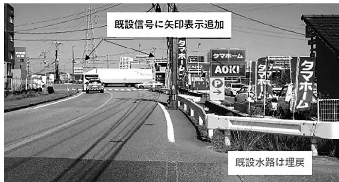
改良予定の上府交差点

これにより県道部分の右折矢印信号が整備され、周辺の渋滞が大きく緩和される見込みです。