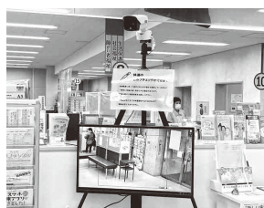
新宮町役場・そぴあしんぐう・シーオーレ新宮にサーモカメラを設置