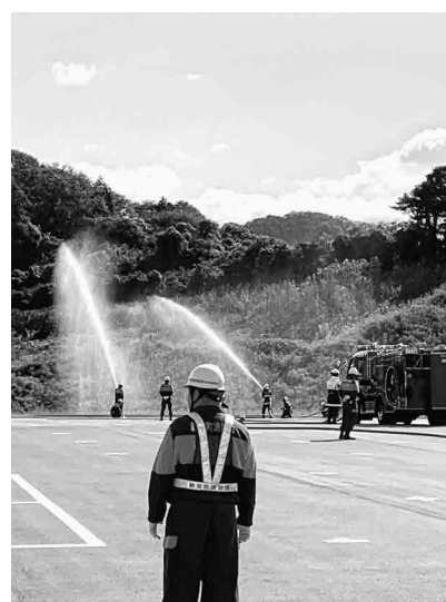
災害に強い町づくりを 2019年10月27日新宮町防災訓練 ふれあいの丘公園にて

消防署や消防団との連携・協力、さまざまな組織やグループなどと連携しながら、地域ぐるみで防災力の向上を図っていく。