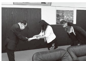
町長へ申し入れを行いました(9月15日)