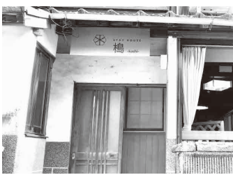
相島地区の定住化対策進む (関連記事3ページ)