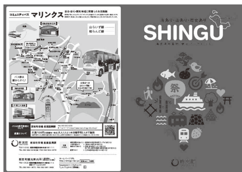
3か国語対応予定の観光パンフレット

A 国の補助事業として、光海底ケーブルを本土側から相島に陸揚げするまでの整備事業を行う。