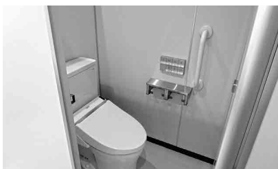
清潔感あふれる改修されたトイレ