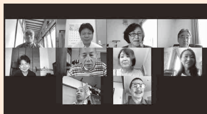
オンライン会議を行いました

令和2年7月29日、8月19日、9月3日、議会改革推進会議を開催しました。今年度の中学生チャレンジ議会は実施しないことを決めました。 また、令和2年9月28日、緊急時に対応できるように、オンラインでの会議を試行しました。