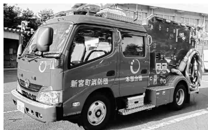
準中型免許が必要となるポンプ車

A ポンプ車が3・5トンを超えているので普通免許では運転できない。現在補助の割合を含め検討している。しっかりと協議しながら前に進めていきたい。