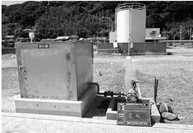
改良工事を行った相島給油施設

A 昨年からはウェブ予約を始めており、30代40代のウェブ予約が増えた。 また不定期受診者に対するしがきでの受診勧奨を行った。