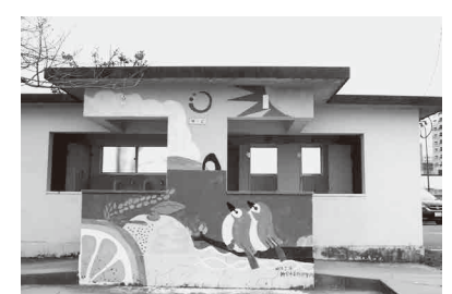
全面改修するトイレ