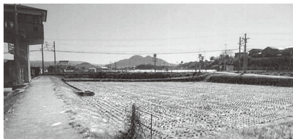
湊井堰公園整備が予定されています