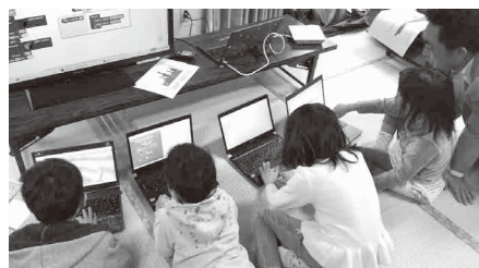
企業と地域で進めている 地域 ICT クラブ

学校では全体に均一な教育をし、また国などから降りてくる教育を進めていく必要があるの自由度が少ない。