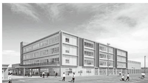
素晴らしい中学校を地域と共に