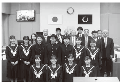
開かれた議会を目指して