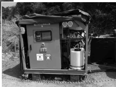
設置された海水淡水化装置