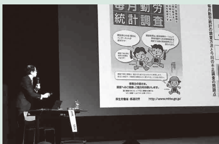
今後の動向について学びました