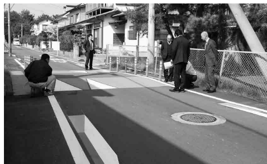
緑ヶ浜地区ハンプを視察しました