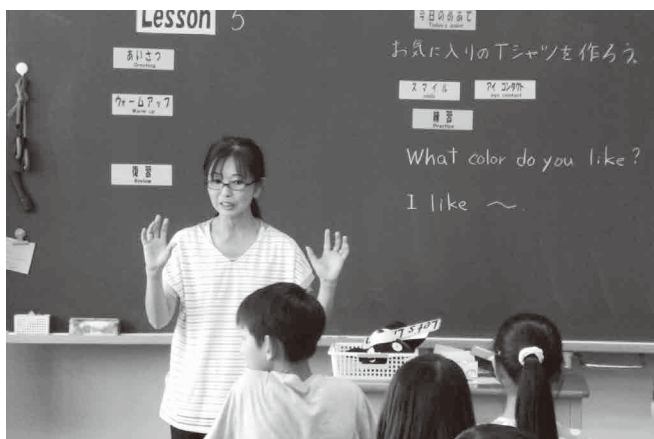
英語学習で人と人とのコミュニケーションを重視

教育長 AIロボットを活用した、他自治体小学校の英語学習での新しい学び方として注目されていることは、承知しており、人型ロボットという媒体を活用することで、子ども達の興味関心や教育効果はあると思う。