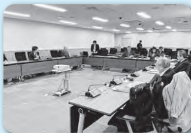
飯田市議会で学ぶ

議会が「存在する」段階から「機能する」段階へ進むため、「地方議会評価モデル」を導入し、スローガン・ミッション・ビジョンを明確化することで、議会の役割を再定義している点が印象的でした。