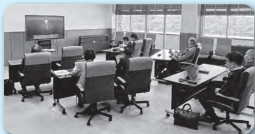
オンラインで学びました

今回の研修を通して学んだ視点を生かし、町民の皆さんにとってより身近で信頼される議会づくりに向け、議会改革に邁進していきます。