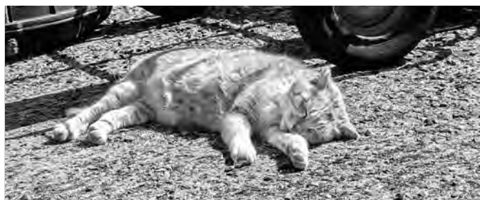
屋寝中の相島の猫

本土側の新宮猫の会は、地域猫活動補助金は支給まで1、2か月かかり猫の妊娠出産に追いつかず、1匹1万円から3万円かかる手術代を、