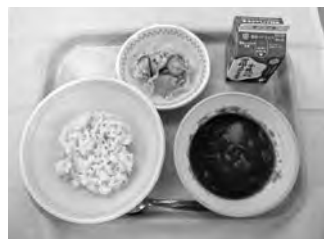
中学校給食費の補助がはじまります

A 健康教室OB会などで地域の団体である。 令和8年度は24団体で、新規9団体の申請があり、要望を踏まえ予算計上している。