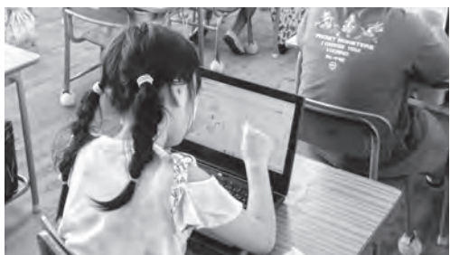
タブレットで学ぶAIドリル