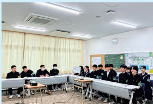
新宮東中学校区いじめゼロサミット

当初、中学校からは「互いを大切に、笑顔あふれるあたたかい居場所をつくろう」という案が示され、小学校側も概ね賛同しました。しかし、「個性をより重視すべき」との意見が出され、短時間で再協議が行われました。その結果、「互