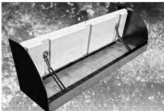
フロート式止水板のイメージ図

雨水の侵入を防ぐため止水板を設置します。また、エレベーターの吸気口を高い位置に付け替えます。