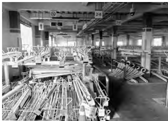
JR 福工大前駅 駅前自転車駐車場2階部分