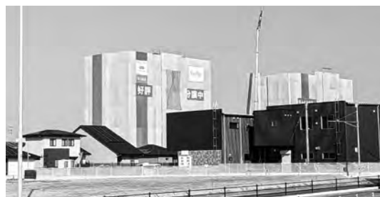
建設が進む人丸地区(下府土地区画整理事業)

教育長 現在、将来の学級数についての検討とともに、段階的な対応も視野に、教育活動に支障が生じないよう準備を進めている。