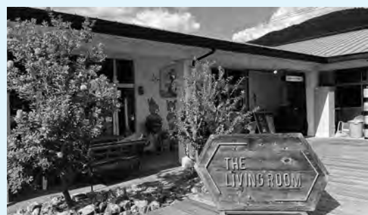
旧保育所を利用した複合施設「GOLDEN RIVER」

本町で進めている「新宮東幼稚園跡地」の活用 は、子どもの居場所づくりを主目的としており 手法は異なりますが、今後、町の公有地利活用 や官民連携事業を計画する際の重要な指針とし て役立ててまいります。