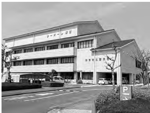
大規模改修が予定されているシーオーレ新宮

問 本町の財産管理は公共施設や公用車・土地などの管理が総務課、その他各担当課が所管の財産管理を担っているが、今後の公共資産は単なる管理から、価値を最大化するアセットマネジメント（資産経営）へ転換すべきと思う。町長の見解を伺う。