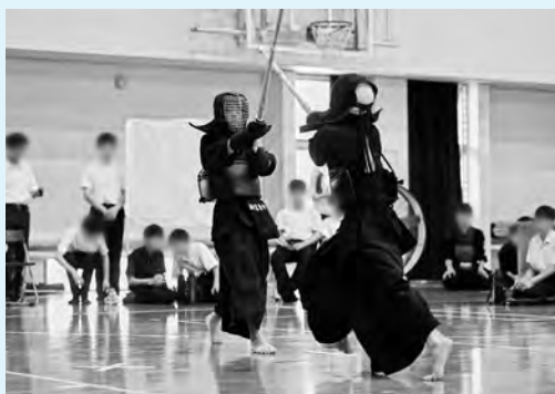
地域連携がすすむ本町の部活動

本町においても、教職員の負担軽減と子どもた ちの充実した活動環境を両立させるため、今回の 先進事例を参考に、最適な地域移行のあり方を議 論してまいります。