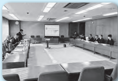
多治見市議会で学ぶ

自由討議は、委員会では議案、全員協議会では議案外のテーマと使い分け、問題意識の共有や提案内容の整理に役立てられています。総合計画には策定段階から関与し、