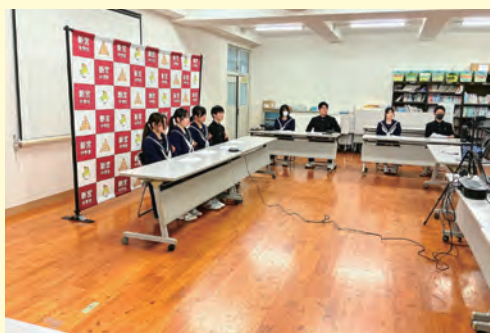
新宮中学校区いじめゼロサミット

アンケート結果からは「いじめはどんな理由があってもいけない」という意識が高まっていることがわかりま