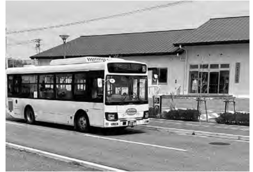
ふれあい交流館前に停車中のマリックス

A ふれあい交流館への便が少ないので検討したい。 バスの台数や、便数などへの影響も踏まえ、何が一番良いかを検討し、諮問していきたい。