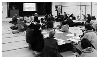
しんぐうライフ主催講演会 「高齢者が生き生きと活躍する場をつくるには」

問 他自治体の「ばあちゃん喫茶」のような高齢者が培った経験や技能を生かし、「ありがとう」が生まれる拠点づくりに対し、場所の提供や運営支援はできないか。 町長 高齢者の人々が培った経験や技能を生かせる場として、地域で実施されているサロン活動の場などが有効だと考えている。 その他、各行政区、新宮町シニアクラブ、新宮町シルバー人材センター、社会福祉協議会など関係機関と連携し、高