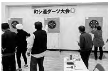
ふれあい交流館利用促進を 町シニアクラブ連合会ダーツ大会

町長 ふれあい交流館は、誰もが利用できる公園内の施設という趣旨で作っている。使用料減免は新宮町公園条例施行規則で定めており、基準改定は検討していない。 しーオーレ新宮、そぴあしんぐう、福祉センターの利用が多く、利用できる施設がないという声があれば検討したい。