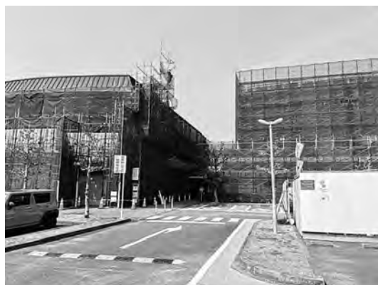
外壁など改修工事中のそぴあしんぐう

町長 案件ごとに関係法令を確認しながら事務を進めており、困難事例については顧問弁護士に相談しているので一定程度の法的妥当性は担保できている。