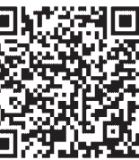
新宮町不登校・ひきこもりサポートはこちら

A 過去に業者側から断られた経緯もあるが、効率化の方法として検討に値する内容である。