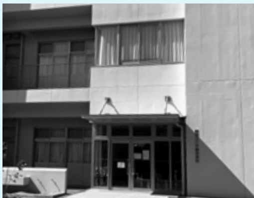
新宮北小学校学童保育所