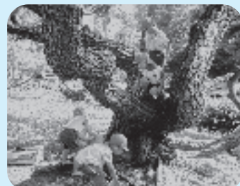
松は自然のジャングルジム

A 自分をのびのびと発揮できること、たくさんの友だちと関わって協力して活動ができることです。