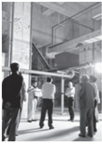
新宮中央浄化センターを視察しました

上下水道課より、災害復旧について詳細な報告を受けました。また、新宮中央浄化センターの被災状況確認のため、現地を視察しました。