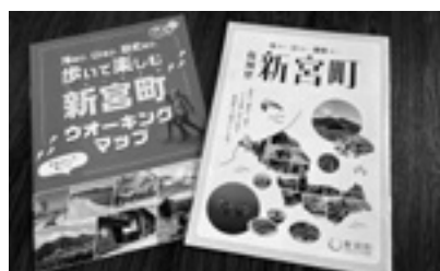
新宮町の観光情報誌