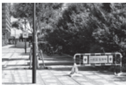
中央駅西口仮設駐輪場

A 駅西口右側の駐輪場から線路沿いに広がった歩道・ポケットパーク部分に設置する。黄色枠と簡易柵で80〜90台分を確保予定である。