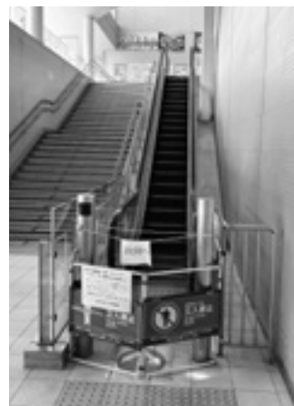
使用できなくなった 東口エレベーター・エスカレーター