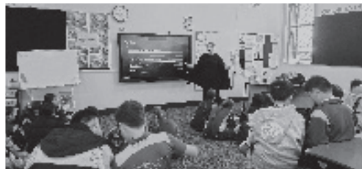
国際感覚を培い社会に貢献できる人材を育てる小中学生海外派遣事業

Q 参加した生徒だけではなく、それ以外の生徒にも学びのあるものにするために考えていることは。