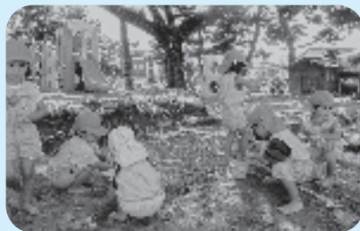
夏でも涼しい松林の園庭

A 園庭が広く、暑くても木陰に行くと涼しいところです。ウサギ小屋もあり、餌やりもできます。