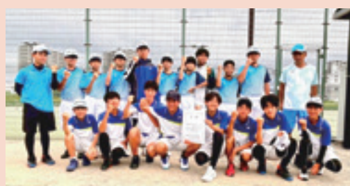
地域に愛される部活動をめざして!!

今年度は、野球部、サッカー部、男子ソフトテニス部、女子ソフトテニス部、個人が筑前地区大会に出場し、陸上部、柔道部、バドミントン、空手道が個人で福岡県大会に出場しました。水泳は個人でそれぞれ、九州大会、全国大会に出場しました。また、吹奏楽部は、吹奏楽コンクール筑前地区大会で金賞、福岡支部大会で銀賞を受賞しました。