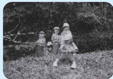
体幹が育つ山の斜面での遊び