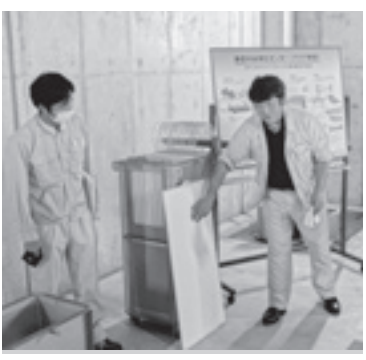
状況説明をする担当職員