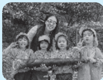
たけのご掘りも楽しいよ!!

A 自然豊かで、先生方も一人ひとりに寄り添ってくださる印象があり、「自然体験」と「少人数保育」が決め手でした。