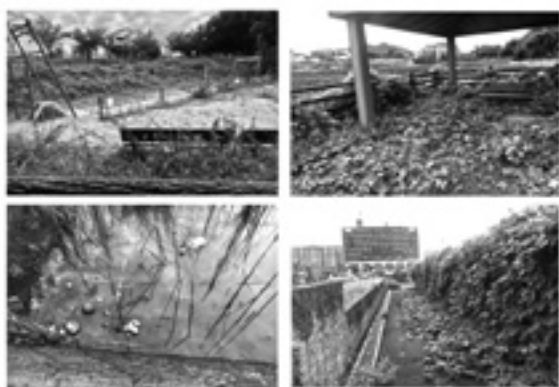
景観が良好とは言えない今池公園 9月2日撮影