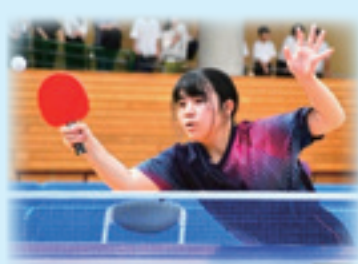
ご声援ありがとうございました

らしかった！周りが一生懸命応援する姿にも心を打たれた、元気をもらった」と、言っていました。3年生の思いを受け継ぎ、1、2年生は次の新人戦に向けて、夏休みから暑い中練習に励んでいます。今後がとても楽しみです。船の時間の関係上、練習時間は十分に取れませんが、体づくりの時間や放課後の時間を上手に使い、心身ともに向上していったほしいと思います。団体戦、個人戦ともに多くの保護者の方々にご来場いただき、熱い声援が飛び交う中、思い出に残る素晴らしい大会となりました。ご声援ありがとうございました。