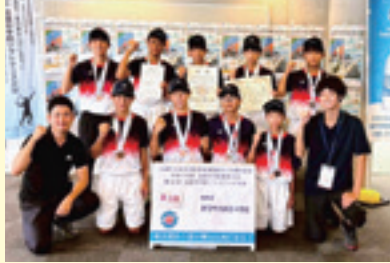
団結が生んだ感動

6月から8月にかけて開催された中学校総合体育大会・コンクールにおいて、新宮中学校からも多くの生徒が出場し、各会場で熱戦を繰り広げました。日ごろの練習の成果を存分に発揮し、力の限りを尽くす選手たちの姿は、実に感動的でした。また、チームメイトや他部活動の仲間の応援、さらには多くの保護者の皆様や地域の方々の声援が各会場に響き渡り、新宮中学校全体が一体となって選手を支える姿に強く心を打た