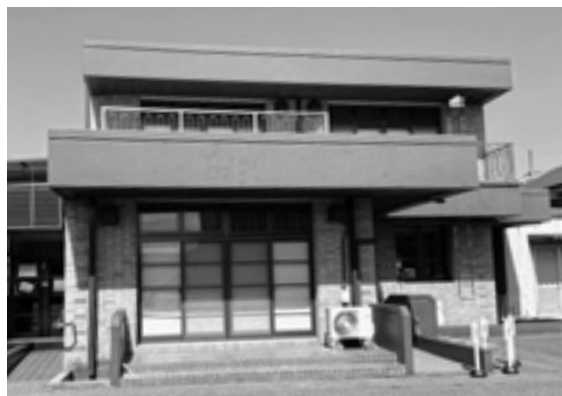
寺子屋事業が行われた夜臼1区公民館

A 福工大生が大半で、学習支援や自由遊びの指導とその見守りなどで協力してもらっている。