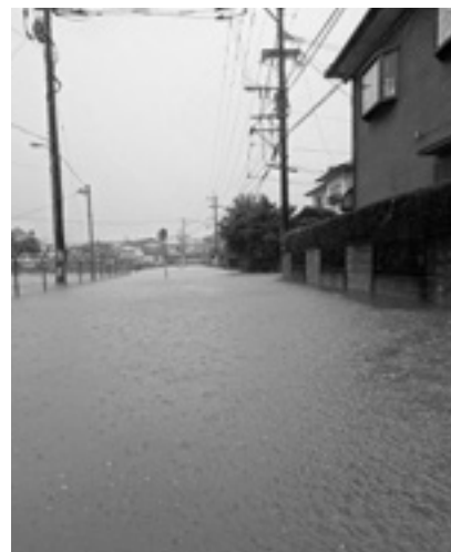
8月10日の大雨被害 (上府地区)

また、今年度は行政区と連携して避難行動要支援者への個別避難計画の策定を予定しており、より有効な情報伝達の実現につながるものと考えている。