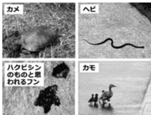
今池周辺で見られる生物や動物のフン

町長 町の管理する公園 が60〜70箇所あり、どこ かだけ特別にはなり得な い。現在できる限りの維 持管理は行っているつも