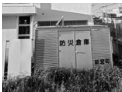
防災倉庫(新宮中学校)

*【自助・共助・公助】自助は自分や家族を守ること、共助は地域で協力して対応すること、公助は公的機関が住民を保護すること。