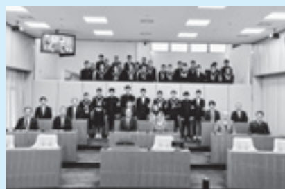
昨年度の中学生チャレンジ議会2024の様子