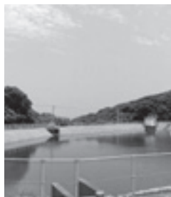
相島第1貯水池(左)、第2貯水池(右)