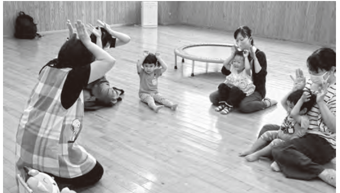
▲6月の「たけのこクラブ」の様子

園庭やプレイルームで自由に遊んだり、手遊びや簡単な製作をしたりなど、親子で一緒に楽しみましょう。保育室の見学もできます。