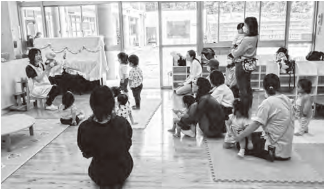
▲6月の「まつぼっくり広場」の様子

新宮幼稚園の園庭とプレイルームを開放します。親子で自由に遊んでください。保育室の見学もできます。