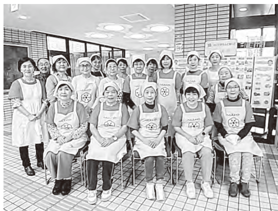
▲会員「私たちがサポートします！」