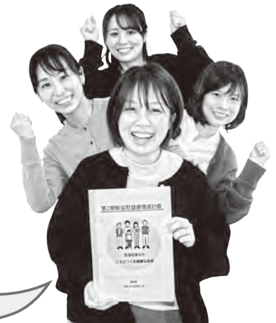
健康福祉課 健康づくり担当

答えは「第2期新宮町健康増進計画」に記載されています。ぜひ探して確認してみてください。