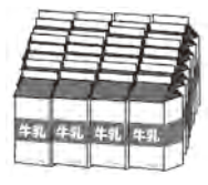
¥95 095'S ⑤ …… 協王

その内、家庭で使っている冷蔵庫、照明器具、テレビ、エアコン使用時の電力量が約半分を占めています。家電を買い替える時は、省エネタイプのを率先して選択しましょう。