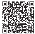
▲説明会に関する情報

説明会の日程は随時更新しています。最新版は次のQRコードから福岡国税局ホームページ「消費税インボイス制度説明会」をご覧ください。