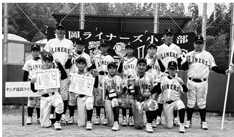
▲頂点に輝き誇らしげな選手たち

九州各地から強豪チームが参加し、町スポーツ協会所属福岡ライナーズ小学部は元気いっぱいにプレーして優勝を勝ち取ることができました。九州の大会では今季2つ目の優勝となりました。選手たちは、次の大会に向けチーム一丸となり優勝をめざして練習に励んでいます。