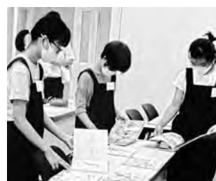
▲読みきかせの絵本選び