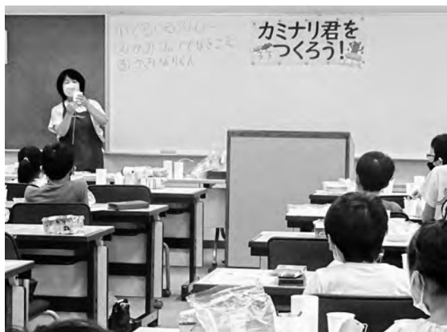
▲理科実験教室「カミナリ君をつくろう！」