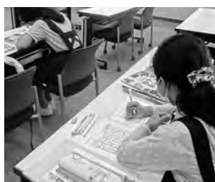
▲本の分類を学びました