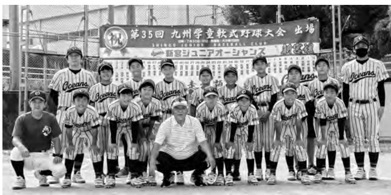
▲祝！九州大会初出場！

町スポーツ協会所属の新宮ジュニアオーシャンズは福岡県代表として初出場し、九州・沖縄各県代表の16チームが参加するなか、準決勝まで勝ち進みました。惜しくも敗れはしましたがベスト4の結果を残すことができました。