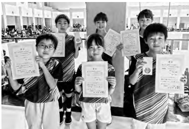
▲ダブルス・シングルスともに絶好調