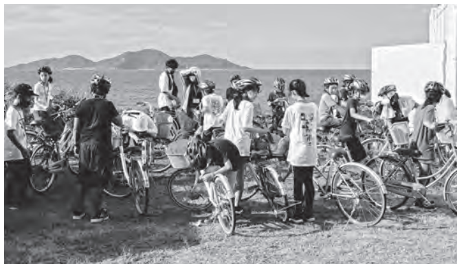
▲昨年のサマーキャンプの様子(サイクリング)