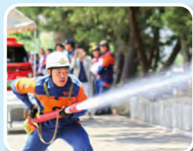
新宮町消防団消防操法大会

福岡県消防操法大会の予選として糟屋地区1市7町の代表(小型ポンプの部、自動車ポンプの部上位2チーム)を決める大会です。