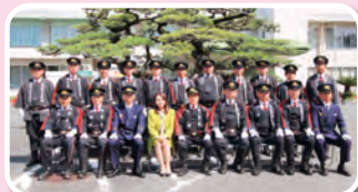
就退団式 集合写真

新分団長と新副分団長および新入団員を対象とした規律訓練など消防団活動の基礎的な訓練が行われます。