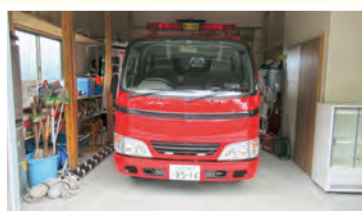
消防車や資機材が格納されています