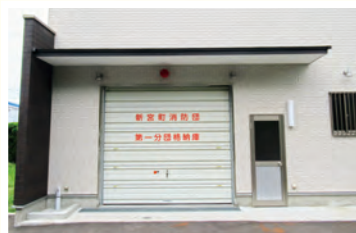
格納庫の外観です