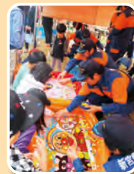
まつり新宮の様子

消防団員間の親睦を深めるため毎年開催しています。昨年度は綱引き大会を行いました。