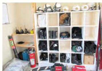
消火活動に必要なホース、火災予防運動など広報警戒に使うのぼり旗など、たくさんの資機材が格納されています