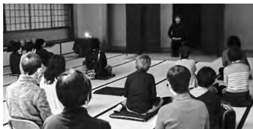
▲昨年の大人のためのおはなし会