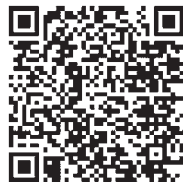
▲健診ガイドはこちらから

予約センター ☎0120-791-376（無料電話） 午前9時～午後5時 （土曜日・日曜日・祝日を除く）