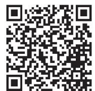
▲友だち登録（無料）はこちらから

環境省LINE公式アカウントを「友だち」登録すると、熱中症警戒アラートのお知らせが届きます。また、お知らせメール受け取り以外にも、メニュー画面から熱中症対策に関わる情報が閲覧できるようになります。