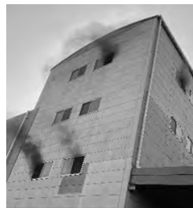
▲エコロの森 火災による黒煙

小型家電や電子機器に使用されている充電式電池は、見落としてしまう可能性があります。そのため、分別収集に出す際は、小型家電や電子機器から充電式電池をなるべく取り外して、それぞれのコンテナ(小型家電または金属混合物と乾電池)に出してください。店舗にある回収BOXにも出すことができます。リサイクルマークが目印です。