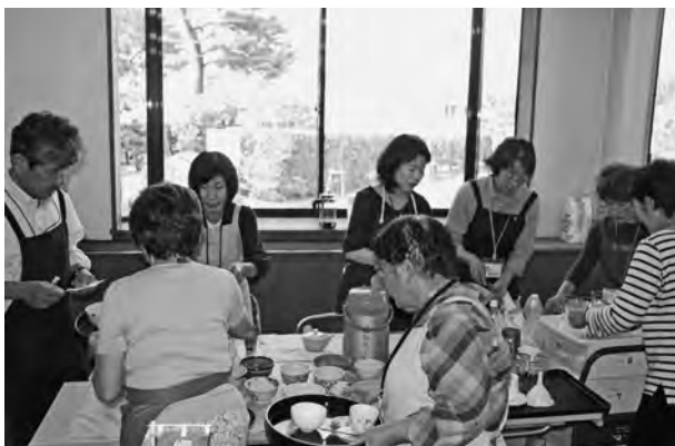
▲傾聴カフェのスタッフ