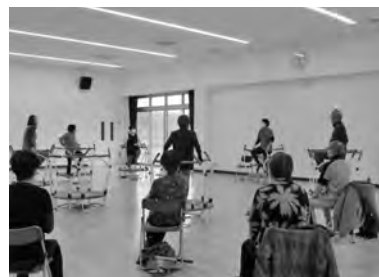
▲ケアトランポリンの様子