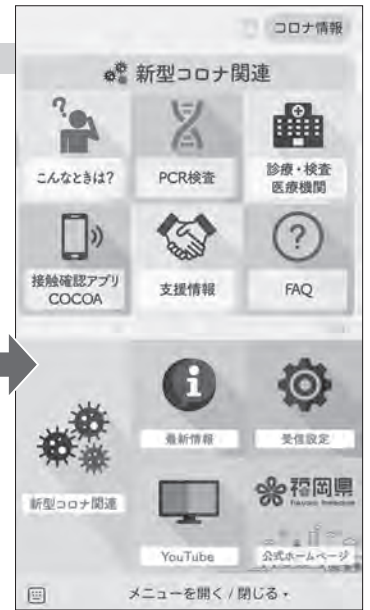
▲メニューの各項目をタップすると情報が開きます