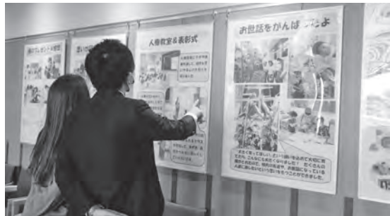
▲そびあしんぐうでのパネル展示の様子