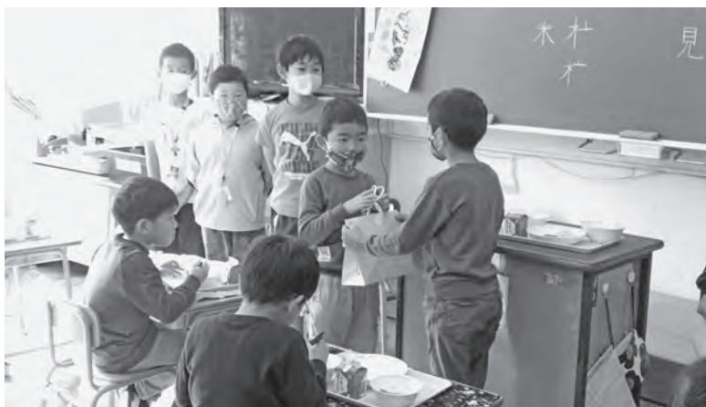
▲全校児童にも種を届けました

ひまわりの種は子どもたちのメッセージ付きの袋に詰め、全校児童に配りました。また、12月5日に開催された人権フェスティバル2020でも、子どもたちの活動の様子をまとめたパネル展示とあわせて配布しました。