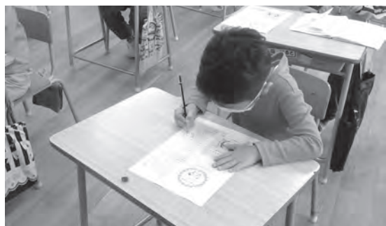
▲種の袋にはその一袋一袋に子どもたちの心温まるメッセージが書かれています

◀種は役場、そびあしんぐう、シーオーレ新宮で配布しています！大切に育ててくださいね♥