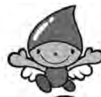
流域連携基金キャラクター ちっこりん

筑後川(ちっこがわ) + 森林(しんりん) そして連携の輪(りん) ちっこい水の妖精が、 PR親善大使として活躍してく れることを期待します。