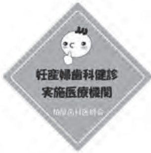
▲産科健診実施医療機関のステッカー