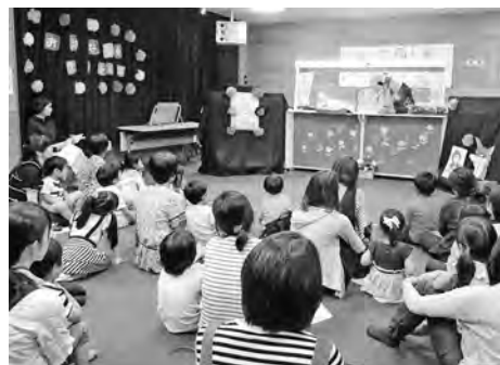
▲あつという間の1時間でした