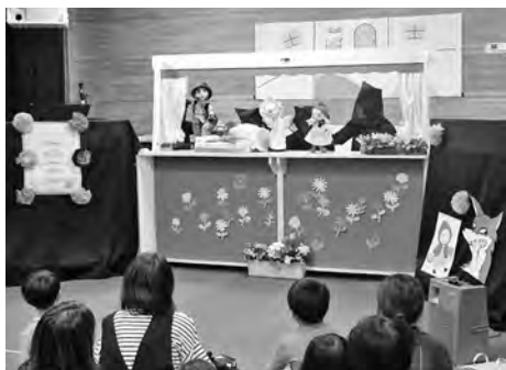
▲くすの木語りの会による人形劇「赤ずきん」