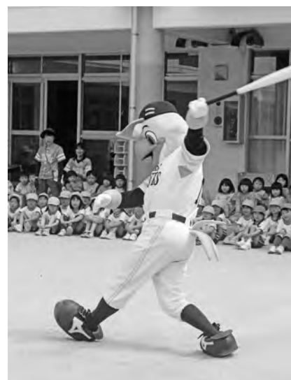
▲ハリーホークのフルスイング！