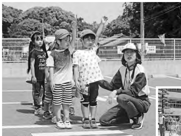
▲手をあげて渡ろうね！