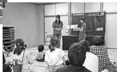
▲おはなし隊による楽しいおはなし