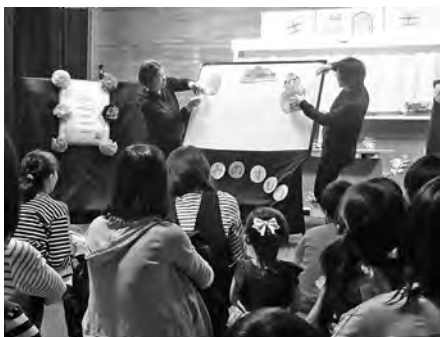
▲マドレーヌによるパネルシアター