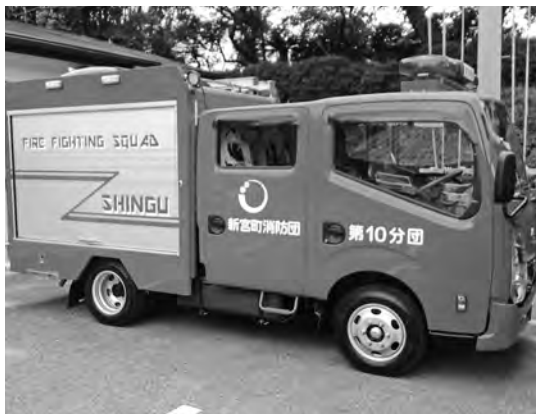
▲町内の安全安心のため、がんばります！