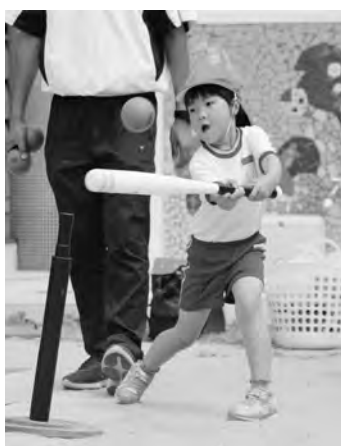
▲ナイスバッティング！

テレビや球場で見るハリーたちが幼稚園に 登場し、子どもたちは大興奮！ハイタッチを したり、ハリーの迫力あるフルスイングに歓 声があがったりするなど、盛り上がりました。