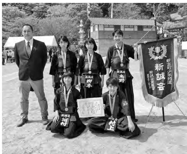
▲第3位おめでとう！新宮新誠会