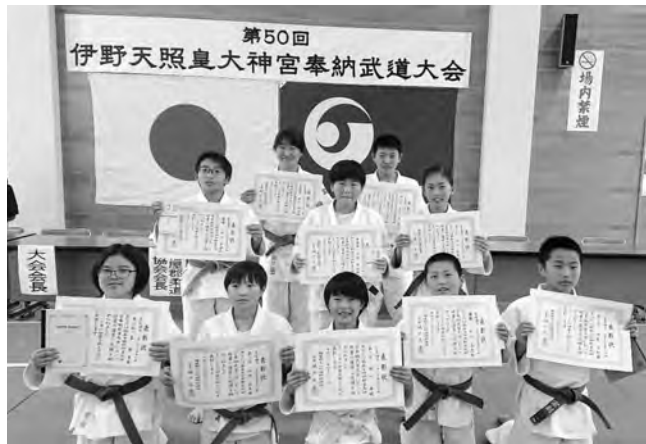
▲大健闘の新宮少年柔道クラブ