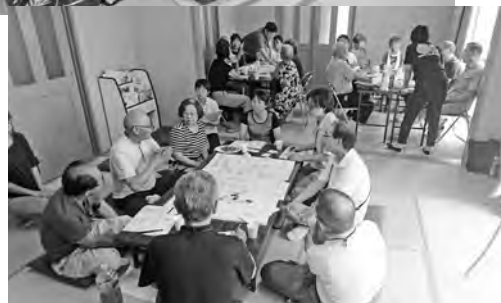
▲活発に意見が出された地域座談会