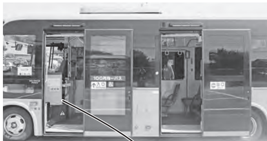
①前方入口ドアから乗車