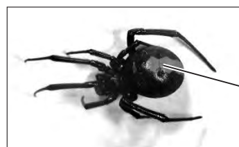
メスのセアカゴケグモ

【子どもや高齢者は特に注意】 病状が悪くなったときは救急病院を受診してください。可能であれば殺したクモを病院に持参してください。