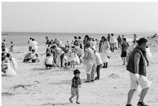
▲昨年のクリーン作戦の様子

※原上区に住む人は、5月上旬に実施予定です。詳しくは後日行政区よりお知らせします。