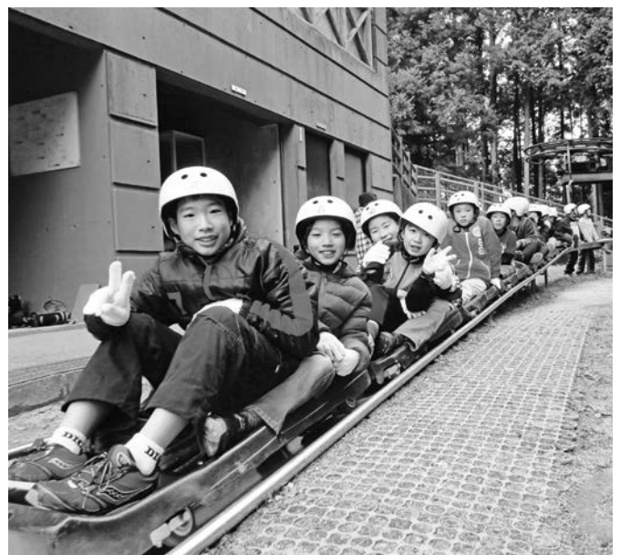
▲前回の林間ボブスレーの様子