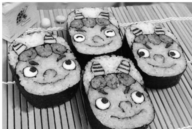
▲写真はイメージです