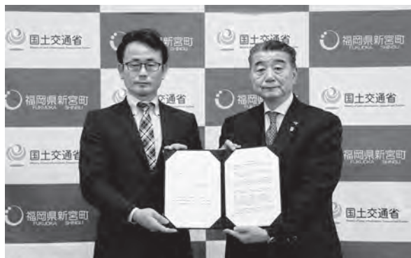
▲桐島光昭町長 (右) に連結許可書を渡す 金井仁志福岡国道事務所長 (左)

スマートインターチェンジとは、ETC専用のインターチェンジ (IC) で、古賀ICと福岡ICの間に設置され、本町の地域振興や企業誘致の促進などが期待されます。