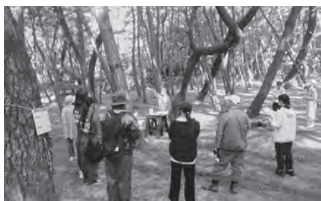
▲松原の歴史を真剣に聞く参加者のみなさん

楯の松原は海からの砂や潮風から私たちの生活を守ってくれる大切な財産です。また、地球温暖化の原因といわれるCO 2 を吸収し、気候変動対策にも貢献しています。町では楯の松原を次世代につないでいくために今後も活動に取り組んでいきます。