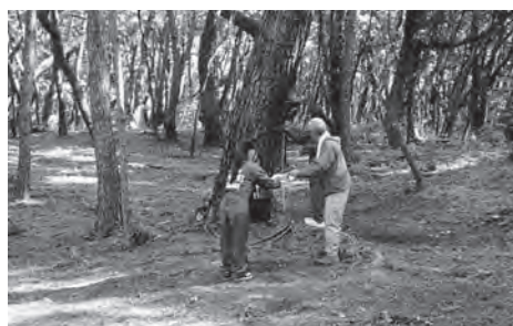
▲協力して松の推定樹齢を算出

町では、令和4年2月に「新宮町ゼロカーボンシティ宣言」を表明し、2050年までに、二酸化炭素排出量を実質ゼロとする「カーボンニュートラル」の実現をめざしています。