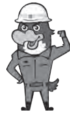
レスキューたかし