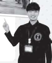
シティプロモーション課 市川