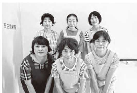
▲歴史資料館で待ってます