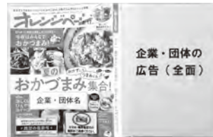
▲最新号のカバーに広告の掲示

★10月27日(金)～11月9日(木)は読書週間 標語 「私のペースで しおりは進む」