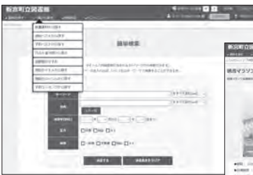
▲パソコンで見る検索画面