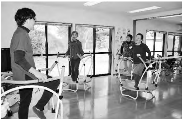
▲桜山手区ケアトランポリン