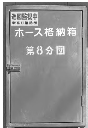
▲ホース格納箱の付近も駐車禁止