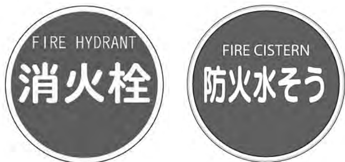
新宮町内の消防水利標識

違法な駐車は、一刻を争う消防活動の妨げとなります。消防水利付近へは駐車しないよう、ご理解とご協力をおねがいします。