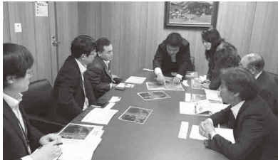
NEXCO西日本九州支社 との意見交換