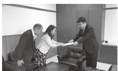
委員長から議長へ 予算措置の依頼