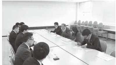
国土交通省・九州地方整備局 との意見交換