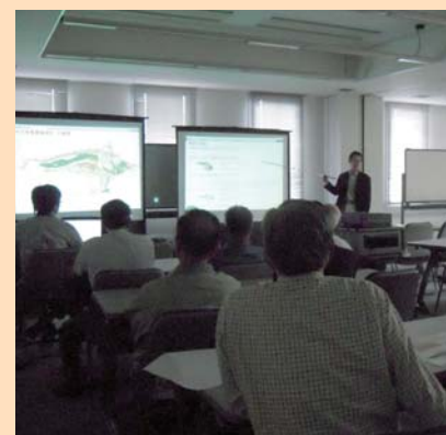
意見交換会の風景

現在の維持・管理活動を把握し、いきものの生態系を保全するとともに、人にとっても魅力的な公園を維持していくために必要な内容を確認し今後の課題を確認しました。