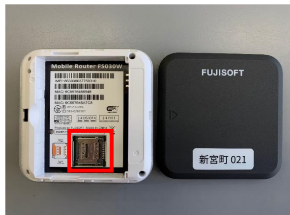
<SIMカード挿入箇所(本体内部)>