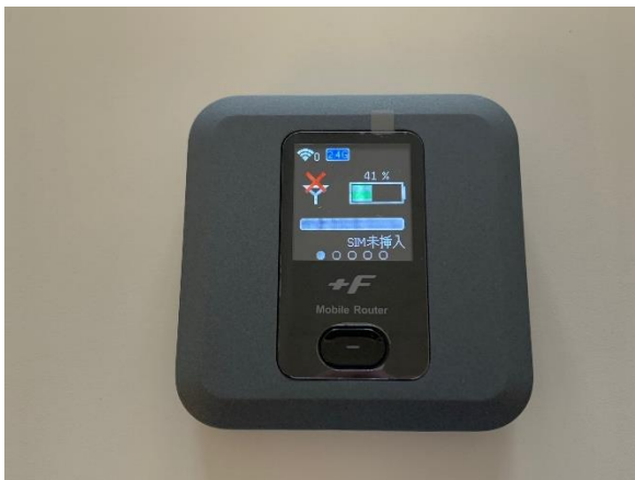
<Wi-Fi ルーター 本体>