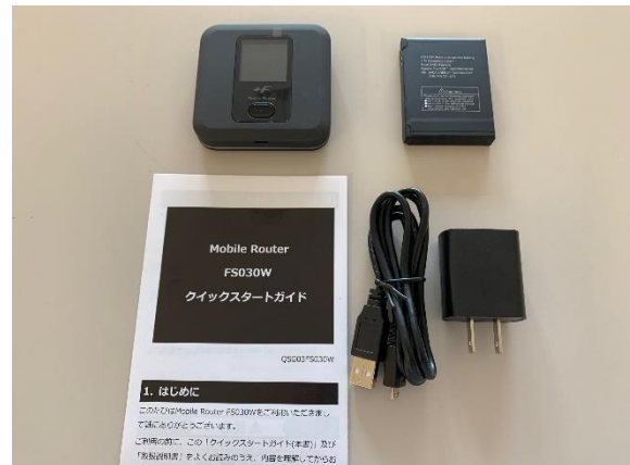
<ケースに含まれる物品>